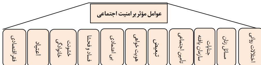
شکل ۱. عوامل مؤثر بر امنیت اجتماعی

امنیت اجتماعی و مؤلفه‌های آن مانند انسجام گروهی، نظم عمومی، سلامت و مهارت افراد، امید به زندگی و امنیت هویت، نقش مهمی در بقاء و بالندگی ملت‌ها دارند (قابل دسترسی در www.ihcs.ac.ir/pages/features ).