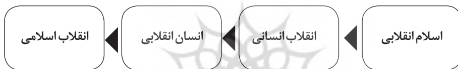
شکل ۱. طرح‌واره مراحل انقلاب در نظریه انقلاب امام خمینی (ره)

امام خمینی (ره) برای فهم انقلاب می‌گشایند، انقلاب اسلامی به مثابه یک تحول اجتماعی صرفاً به دیگر تحولات اجتماعی بازگشت داده نمی‌شود و پای نوعی انقلاب انفسی و درونی به میان می‌آید. نظریه انقلاب امام خمینی (ره) بر خلاف نظریه‌های مدرن که انقلاب اجتماعی را صرفاً محصول انقلاب از بیرون می‌دانند، (بومر، ۱۳۸۵، ص. ۳۲۴). ضمن در نظر گرفتن عوامل بیرونی به عنوان عوامل اعدادی و زمینه‌ساز، «انقلاب انسانی» و درونی را اصل، ضرورت و مبنای انقلاب اجتماعی دانسته می‌شود و با تأکید بر تحول بنیادین انسان‌ها و پدید آمدن انسان انقلابی، چگونگی، پیامد و علل «انقلاب اسلامی» را تشریح می‌کنند. بر این اساس اگر بخواهیم بر اساس مقوله‌بندی ادبیات امام خمینی (ره)، نظریه ایشان درباره تغییر اجتماعی و انقلاب اسلامی را تشریح کنیم، چهار مرحله و مفهوم ذیل را در آن قابل تشخیص است: